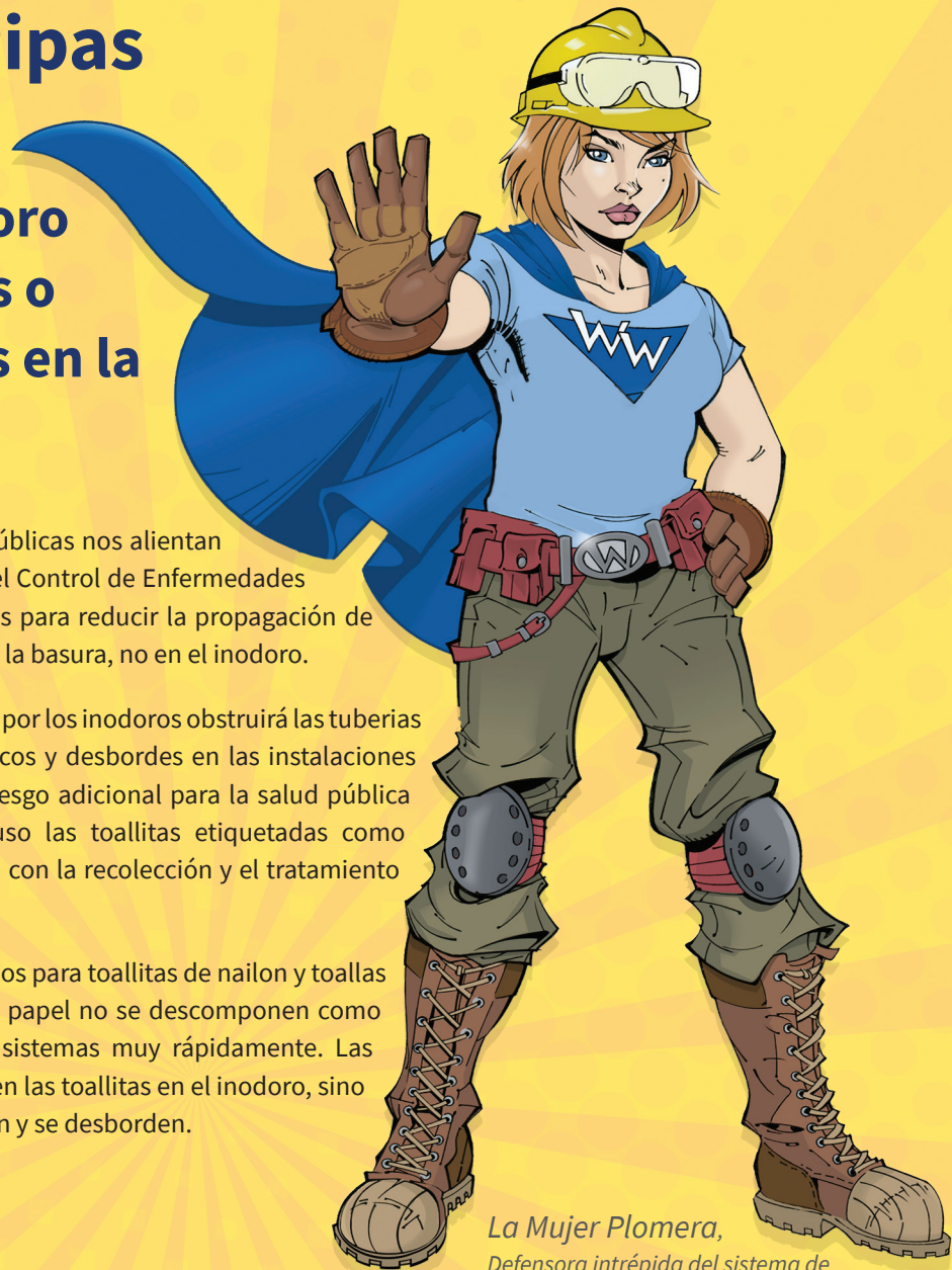
La Mujer Plomera, Defensora intrépida del sistema de drenaje alcantarillado

Los sistemas de aguas residuales no fueron diseñados para toallitas de nailon y toallas de papel individuales. Las toallitas y las toallas de papel no se descomponen como el papel higiénico y, por lo tanto, obstruyen los sistemas muy rápidamente. Las instalaciones piden a los residentes que no desechen las toallitas en el inodoro, sino que las tiren a la basura para evitar que se acumulen y se desborden.